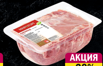
Свинина карбонад, с/м, б/к, в/у, 3 мм шпика, «Мираторг», 2,1 кг