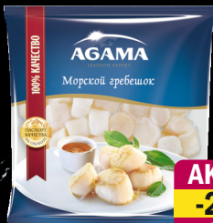
Морской гребешок, с/м, Агама, 250 г