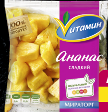
Ананас, с/м «Витамин», 300 г