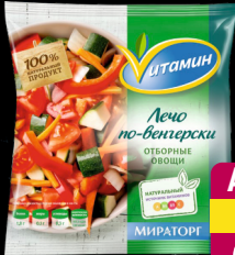
Лечо По-венгерски «Витамин», 400 г