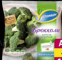
Брокколи «Витамин», 400 г