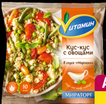
Кус-кус с овощами в соусе Марокко, с/м, Витамин, 400 г