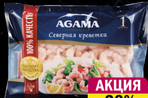
Креветки очищенные, в/м, №1, Агама, 210 г