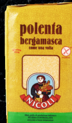
Мука кукурузная «Полента», 1 кг