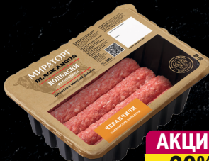
Колбаски из мрам. говядины «Чевапчичи», с/м, Мираторг, 300 г